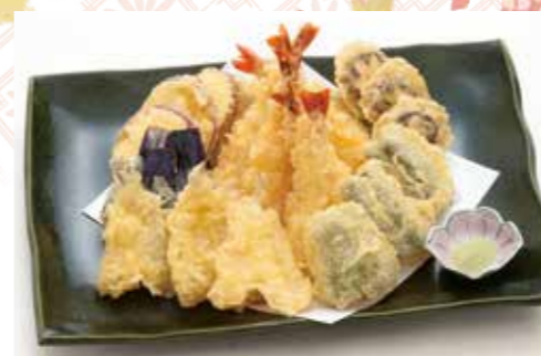
D-08 天ぶら盛り合せ 6,800円(税込7,480円)