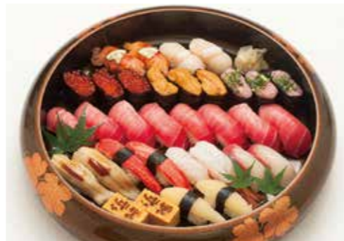
D-03 江戸前にぎり鮓(特上)(3人盛) 10,500円(税込11,550円)