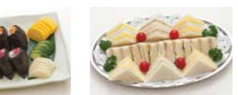
D-16 おにぎりセット(10ヶ入) 2,200円(税込2,420円)