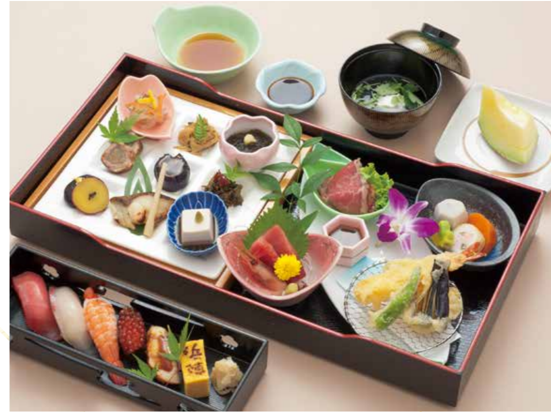
A-06 雪中花 せつちゅうか 8,300円 (税込9,130円)