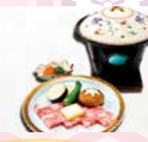
B-13 牛肉陶板焼き 2,500円 (税込2,750円)