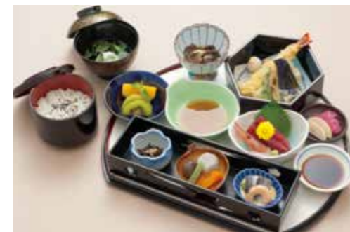
A-07 花衣 はなごりも 3,300円 (税込3,630円)