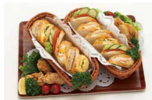
D-12 バケットサンド 4,000円(税込4,400円)