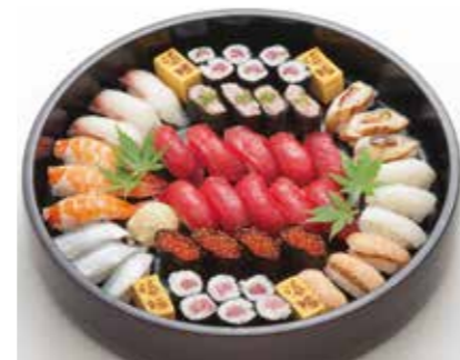
D-04 江戸前にぎり鮓(上)(5人盛) 11,000円(税込12,100円)