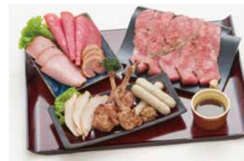
D-11 コールミート盛り合せ 8,000円(税込8,800円)