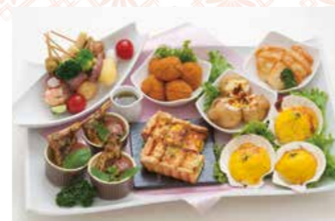
D-07 ミックスオードブル 9,000円(税込9,900円)