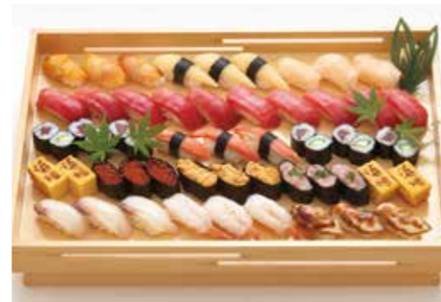
D-02 江戸前にぎり鮓(特上)(5人盛) 17,500円(税込19,250円)