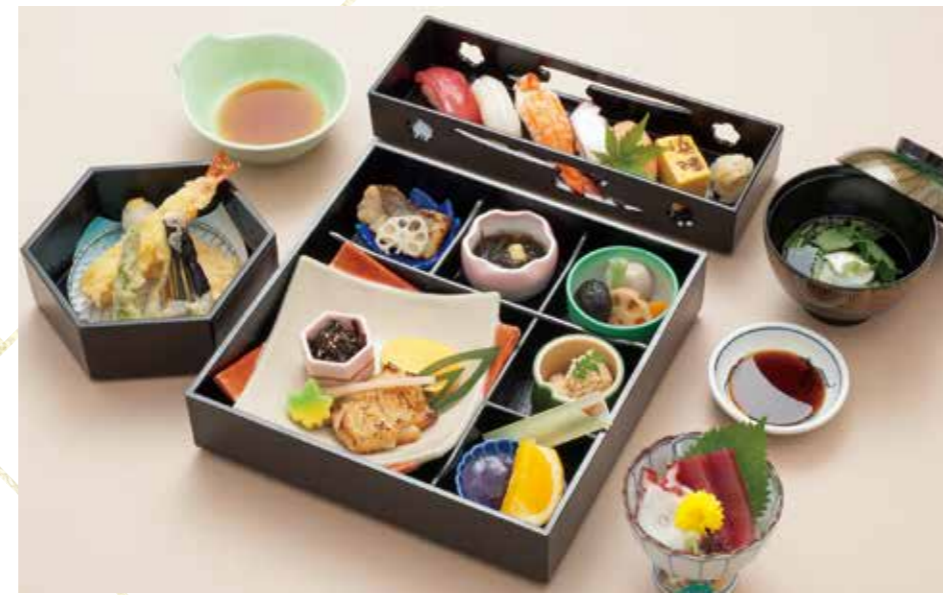
A-02 木蓮 もくれん 5,000円 (税込5,500円)