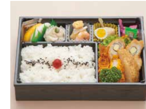
B-01 白椿 しらつばき 1,700円 (税込1,870円)