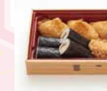
B-12 いなり巻き 800円 (税込880円)