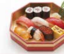
B-10 にぎり鮓 1,700円 (税込1,870円)