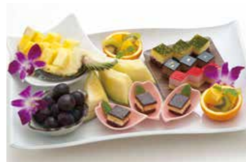
D-14 フルーツ&プチケーキ 6,800円(税込7,480円)