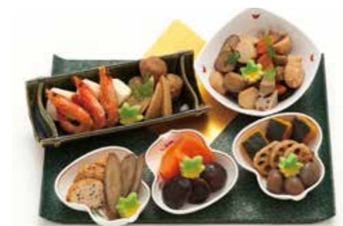
D-09 煮物盛り合せ 4,000円(税込4,400円)