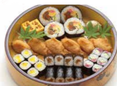
D-06 巻き鮓(3人盛) 5,000円(税込5,500円)