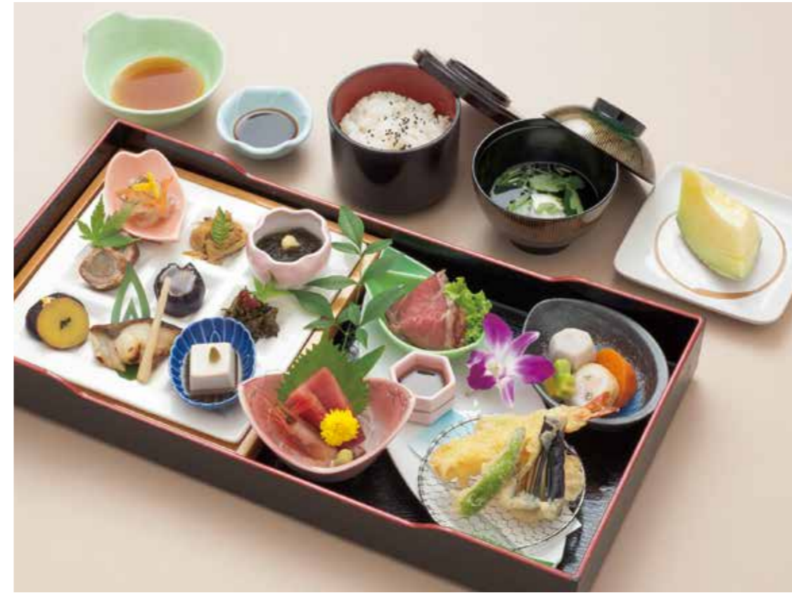
A-05 水仙花 すいせんか 7,200円 (税込7,920円)