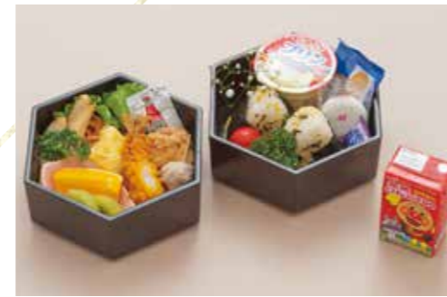
A-08 お子様ランチ 1,700円 (税込1,870円)