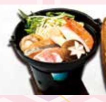
B-14 海鮮鍋 1,700円 (税込1,870円)