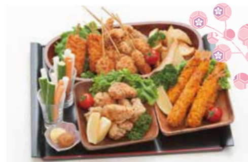
D-10 フライ盛り合せ 5,000円(税込5,500円)