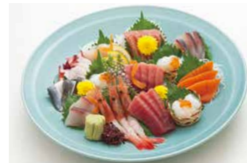
D-13 お造り盛り合せ 7,000円(税込7,700円)