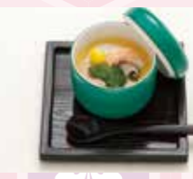
B-08 茶碗蒸し 600円 (税込660円)