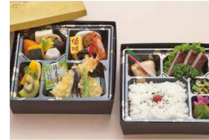
B-04 玉椿 たまづばき 4,400円 (税込4,840円)