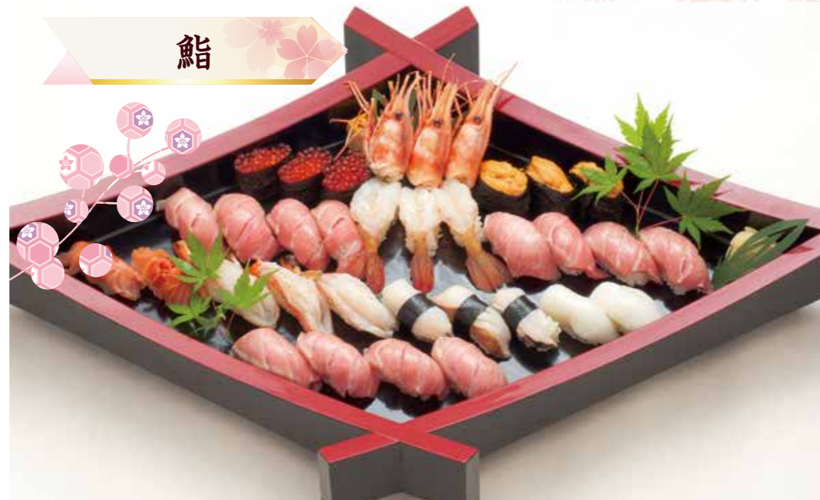
D-01 江戸前にぎり鮓(極上)(3人盛) 16,500円(税込18,150円)より ※写真は5人盛です