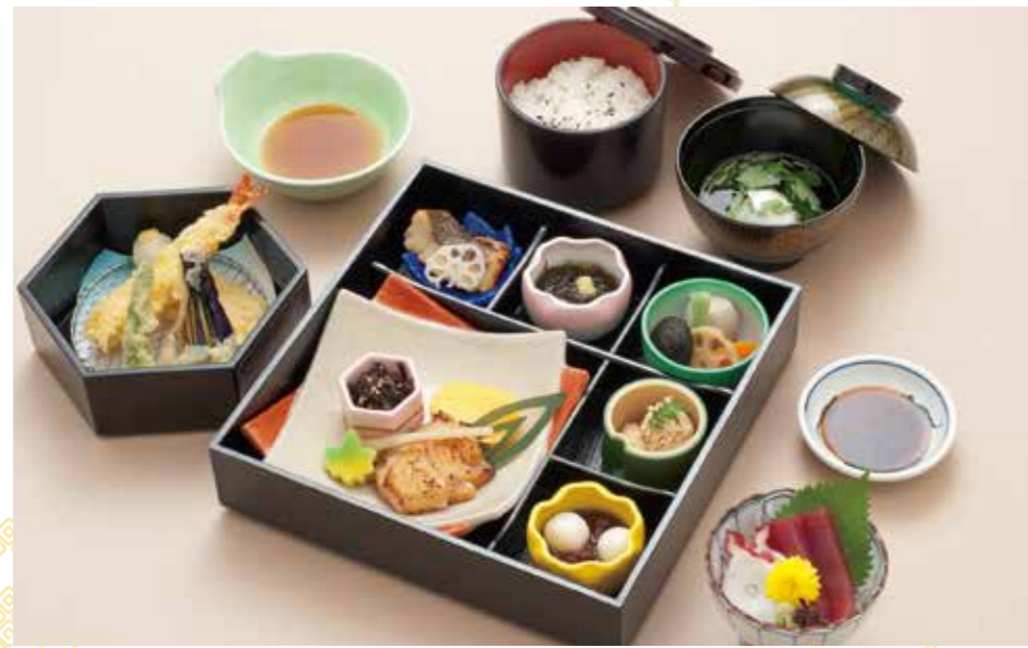
A-01 若紫 わかじらき 4,500円 (税込4,950円)