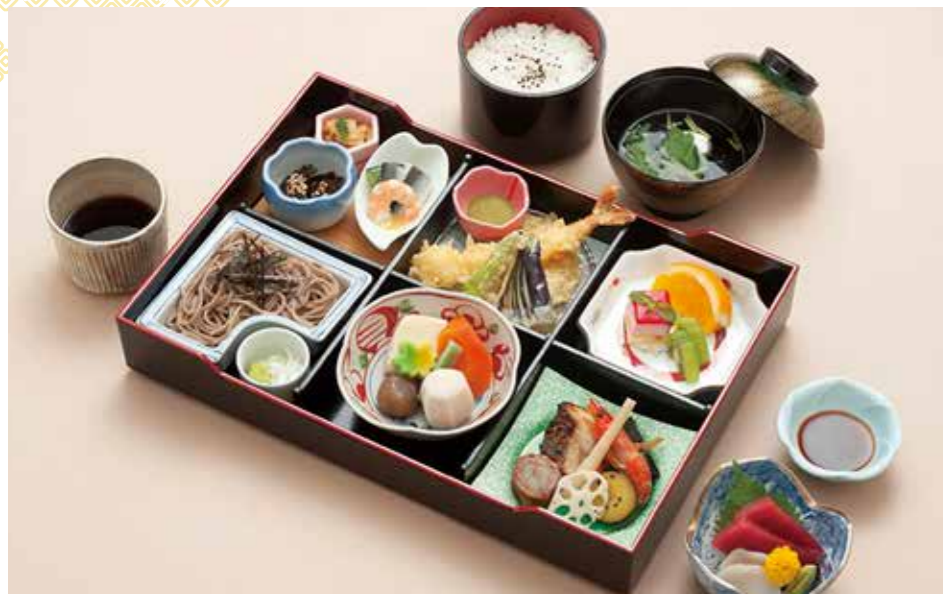
A-03 白牡丹 しらぼたん 5,500円 (税込6,050円)