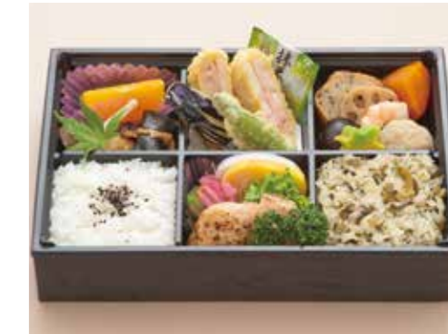
B-02 山椿 やまづばき 2,800円 (税込3,080円)