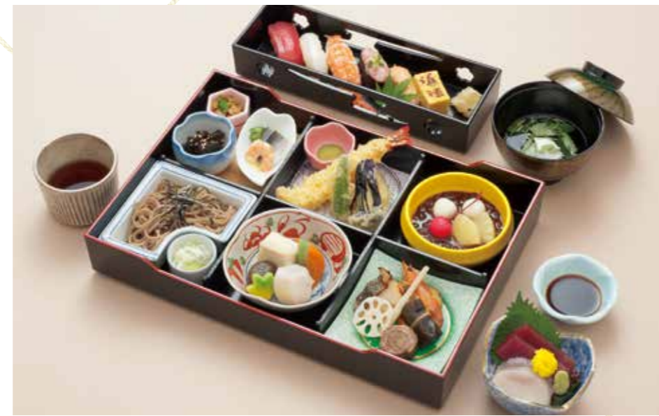
A-04 草紅葉 くさこみじ 6,100円 (税込6,710円)