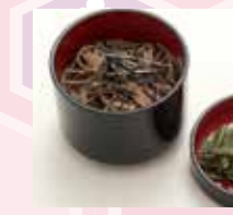
B-09 御蕎麦 (温または冷) 600円 (税込660円)