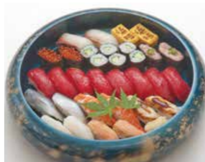
D-05 江戸前にぎり鮓(上)(3人盛) 6,600円(税込7,260円)