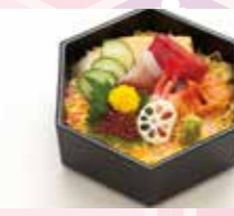
B-07 海鮮ちらし 1,700円 (税込1,870円)