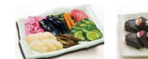
D-15 お新香盛り合せ 2,000円(税込2,200円)