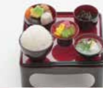
B-11 供養膳 1,200円 (税込1,320円)